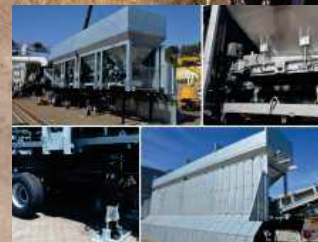
Mobile Hopper Bins Groupe de Trémies Mobile