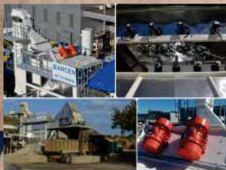
Mixer Mobile Unité Unité Mobile de Malaxage