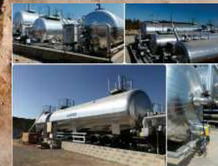
Mobile Bitumen Storing Tank Parc à Liants Mobile