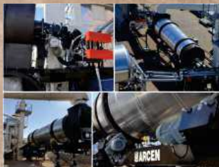
Mobile Drum Dryer Sécheur Mobile