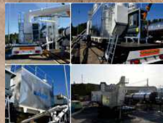
Mobile Baghouse Filter Filtre à Manches Mobile